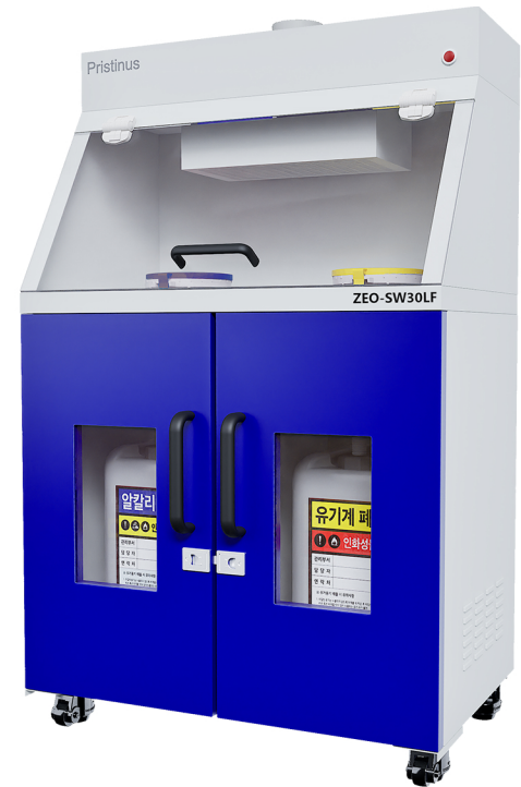
ZEO-SW30LFC / ZEO-SW30LF