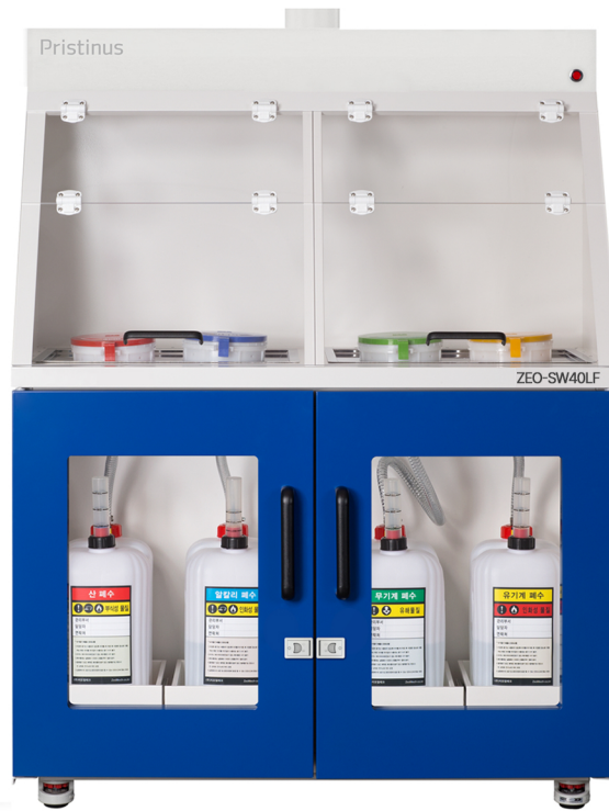
ZEO-SW40LFC / ZEO-SW40LF